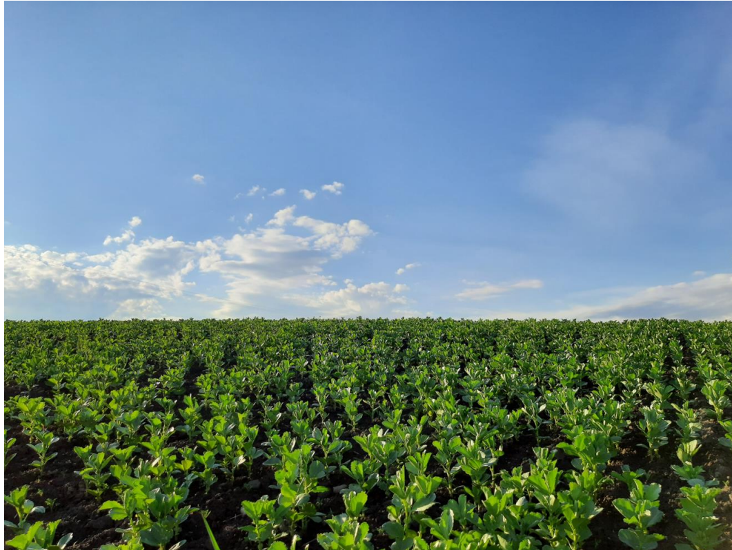
Aki Laaksonen maanviljelijä agronomi